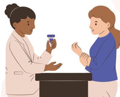
Figura 3: Enfoques utilizados para proporcionar apoyo al autocuidado (3)

Los datos del FIP ponen de manifiesto el apoyo que prestan los farmacéuticos en materia de alfabetización sanitaria, atención preventiva y enfermedades no transmisibles en una amplia variedad de ámbitos, entre los que se incluyen el dolor de garganta, los síntomas respiratorios, los trastornos gastrointestinales, el tratamiento del dolor, la nutrición, la salud sexual y los productos naturales para la salud (4-10).